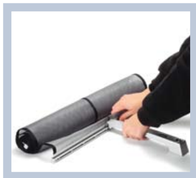
A rendszer szétszereléséhez csak válassza le a támasztórudat és a lábat, majd hajtsa össze az anyagot.