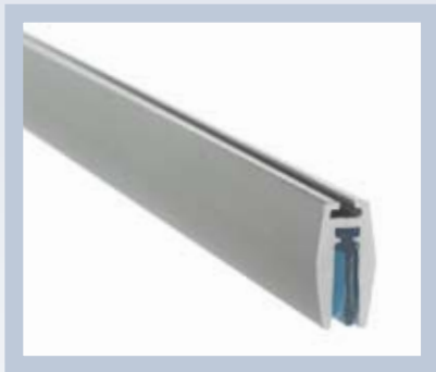
Conception esthétique et discrète qui ne détourne pas l'attention de l'illustration.