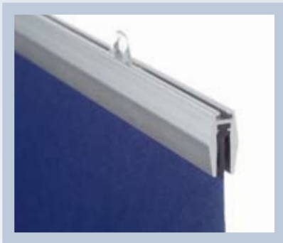
La glissière adhésive en plastique permet de changer d'illustration en toute simplicité.