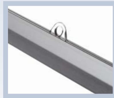
Œillets de fixation réglables.