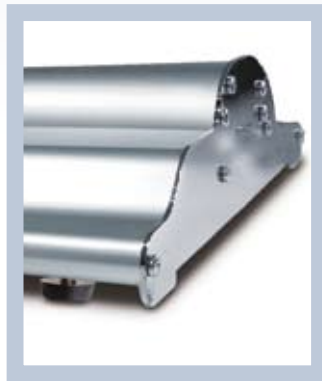
Un diseño estable con pies de estabilización que compensa las desigualdades del piso.