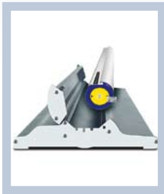
La imagen va perfectamente protegida durante el transporte.

Roll Up Classic ha sido premiado por Föreningen Svensk Form, por su combinación de funcionalidad y diseño. El sistema es fácil de llevar y se monta rápidamente para la presentación. Disponible en varias anchuras, Roll Up Classic ha sido concebido para uso repetido en distintos entornos.